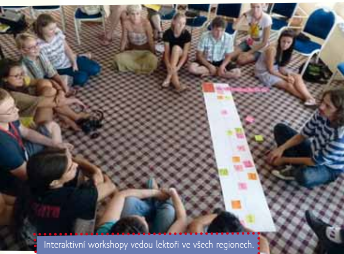
Interaktivní workshopy vedou lektori ve všech regionech.

Celý modul realizují spolupracovníci Eurodesku, zkušení pracovníci s mládeží a lektori, kteří jsou na moduly proškoleni. Program se zpravidla koná přímo ve škole v době vyučování a trvá 2 vyučovací hodiny. Má formu interaktivního semináře. Během 90 minut jsou studentům předávány informace o daném tématu, zároveň studenti mají díky interaktivním metodám neformálního vzdělávání prostor pro diskusi a vyjádření vlastních názorů.