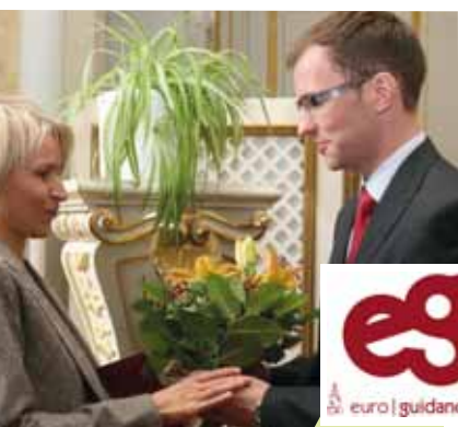
Předávání Národní ceny kariérového poradenství 2010

A právě rozvoj zmíněných dovedností je tématem letošního ročníku Národní ceny kariérového poradenství 2012 , kterou již počtvrté vyhláší české Centrum Euroguidance , tentokrát ve spolupráci s Euroguidance centrem Slovenské republiky při Slovenské akademické asociaci pro mezinárodní spolupráci (SAAIC). Do letošního ročníku se mohou přihlásit jak poskytovatelé služeb kariérového poradenství pro děti a mládež, tak ti, kteří svou činnost zaměřují na dospělé; soutěž je otevřena i zaměstnavatelům, kteří v rámci svých organizací nabízejí svým zaměstnancům služby kariérového poradenství.