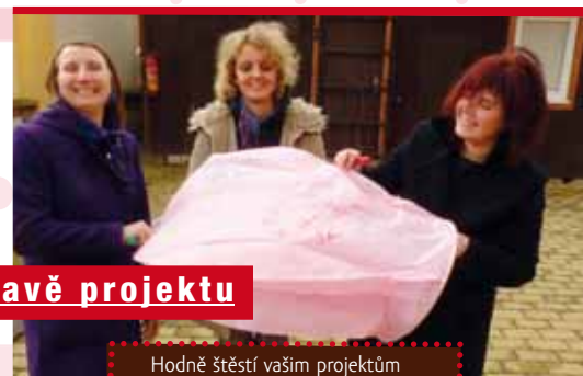
Hodně štěstí vašim projektům

« Vedle zkušeností v práci s mládeží prošli naši koučové ročním školením, kde se seznámili s koučinkem, jeho metodami i filozofií. Trénovali koučování jednotlivců, seznámili se se skupinovým koučinkem, učili se koučovacím přístupům i kladení koučovacích otázek či efektivní komunikaci. Mají už za sebou praktické zkušenosti z individuálního koučování